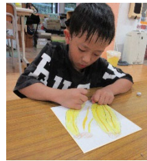
文化展へ向けて制作☆